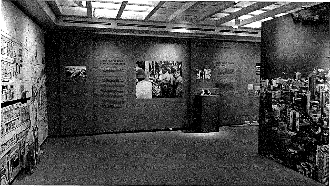
Blick in die neue Ausstellung «Von alten Schuhen leben» des Völkerkundemuseums der Universität Zürich.