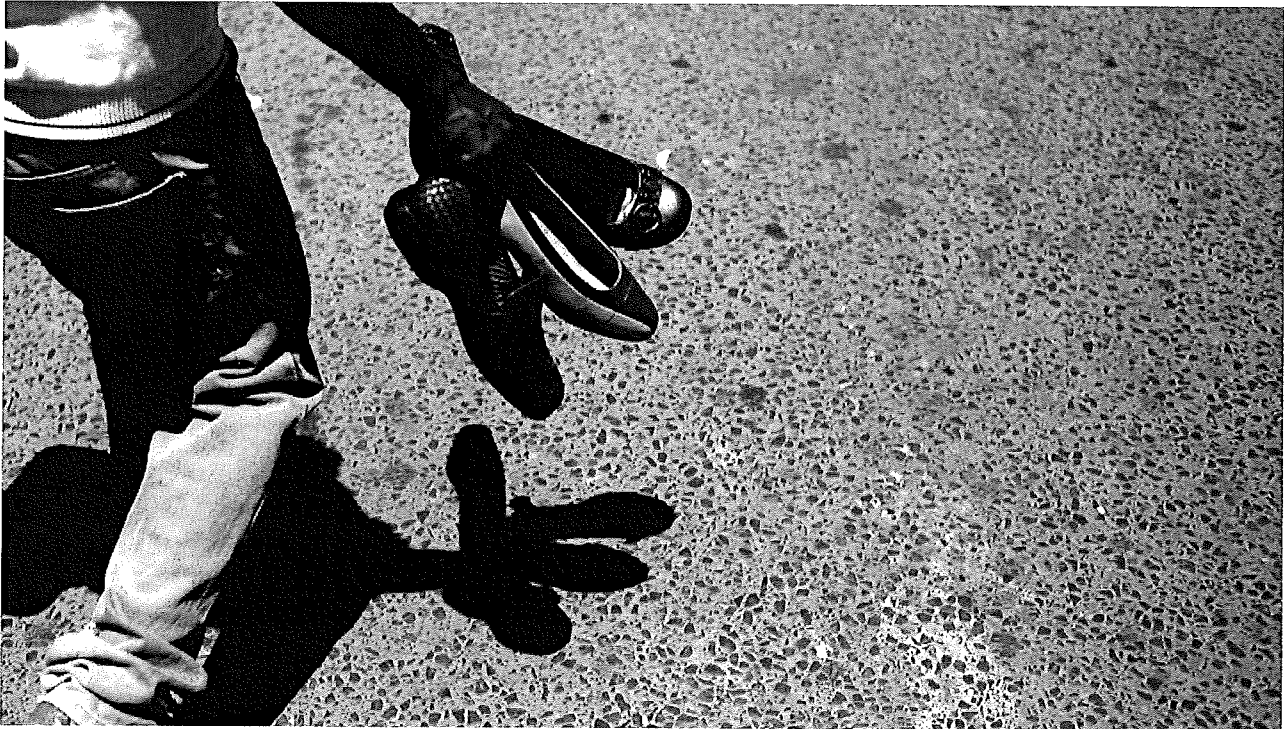
Tausende von Strassenhändlern leben in Tansania vom Verkauf gebrauchter Schuhe.