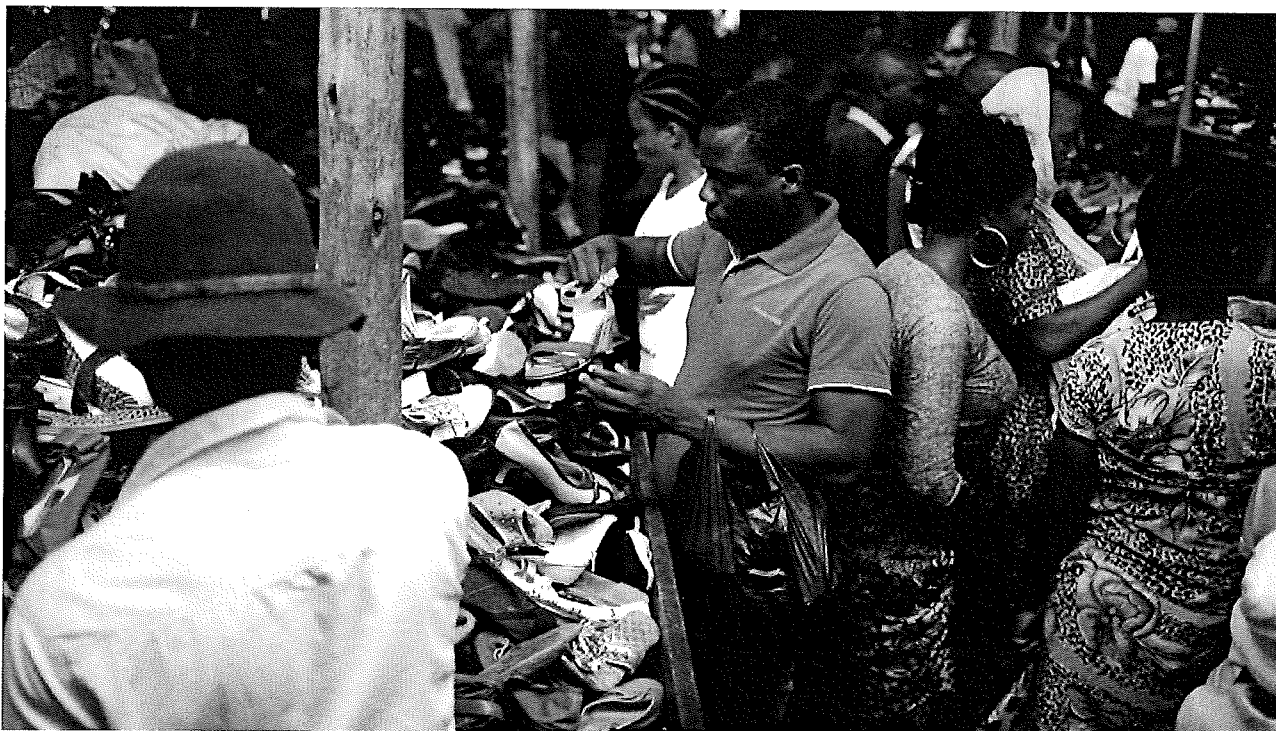
Der Karume-Markt ist der grösste Markt für gebrauchte Schuhe in Dar es Salaam.