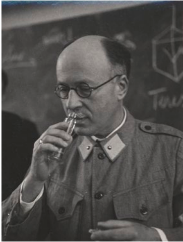
Erforschte Duftstoffe und Hormone und diente während des Zweiten Weltkriegs in der Schweizer Armee: Leopold Ruzicka.