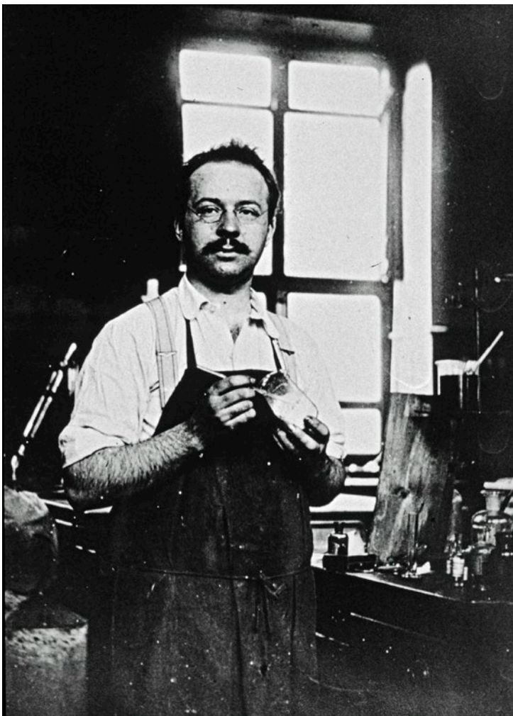
War seinem Fach völlig ergeben: Leopold Ruzicka als junger Chemiker.